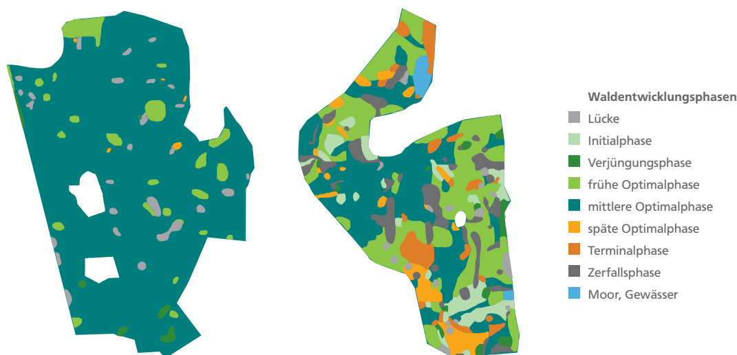
Abbildung 3: Verteilung der Waldentwicklungsphasen in einem bewirtschafteten Buchenwald (38,8 ha, links) und einem seit über 100 Jahren unbewirtschafteten NWR (13,6 ha, rechts)