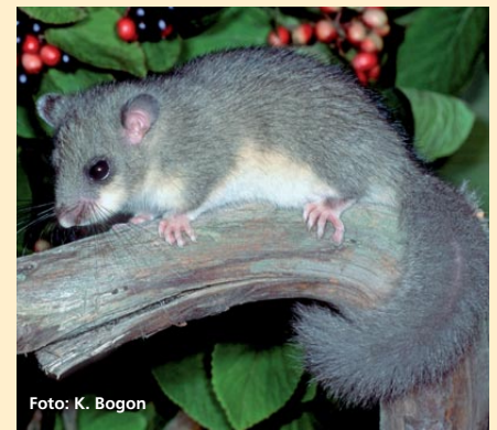
Abbildung 2: Die drei weiteren Bilche, die in Bayern vorkommen: Haselmaus, Baumschläfer und Siebenschläfer (v.l.n.r.)