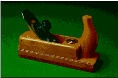
Abb. 12: Lange Zeit gehörte Birnbaum zu den wichtigsten Holzarten für Werkzeuge. Für Spezialwerkzeuge, wie Putzhobel, konnte er sich bis heute behaupten.

In früheren Zeiten zählte Birnbaum zu den wichtigsten Holzarten für wissenschaftliche Instrumente und Stethoskope. Auch viele Werkzeuge, wie Hobelkorpuse (Abb. 12), Zollstöcke, Schablonen, Lehren und Werkzeuggriffe wurden vielfach aus ihm hergestellt. Andere frühere Verwendungsbereiche, bei denen man insbesondere die Härte, Zähigkeit und hohe Spaltfestigkeit nutzte, waren unter anderem Maschinenteile, Riemenscheiben, Zähne und Stücke von kleinen Getrieberädern, Pressen und Spindeln von Obst- und Weinpressen, Webschützen, Mangelrollen, Spinnräder, Druckformen, Drucklettern für Plakatschriften, Druckwalzen für den Zeug- und Tapetendruck, Kugeln, Kegel und Holzschrauben.