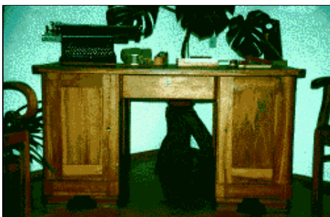
Abb. 10: Beispiel der Verwendung von Birnbaum als Massivholz. Die Mitverwendung des dunkelfarbigem Falschkernes lässt das Möbel besonders dekorativ erscheinen und verleiht ihm zugleich Unikatcharakter.

Zu den Spezialverwendungen des Birnbaumholzes gehört wegen seiner hohen Formbeständigkeit seit jeher die Anfertigung von Zeichen- und Messgeräten, wie von Reisschienen, Winkeln, Maßstäben, Linealen (Abb. 11) und die vom Förster gebrauchten Kluppen. Allerdings ist Birnbaum aus diesen Verwendungsbereichen weitgehend verdrängt worden und sowie überhaupt noch Holz berücksichtigt wird, handelt es sich zumeist um die leichter beschaffbare und billigere Rotbuche. Im Formen- und Modellbau besitzt Birnbaum beste Eignung für die Anfertigung kleinerer Gussmodelle, von denen bei starker Beanspruchung zugleich eine sehr hohe Genauigkeit gefordert wird. Im Sportgerätebau ist er neben anderen Obsthölzern eine gesuchte Holzart für Eisstöcke.