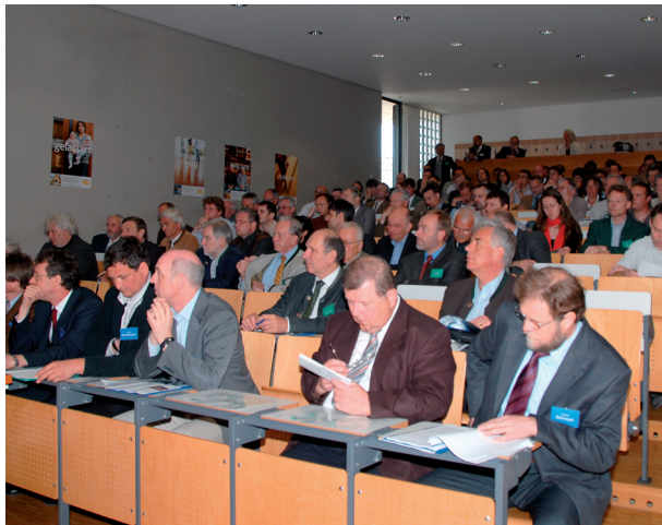
Teilnehmer des Statusseminars 2008

Das Zentrum Wald-Forst-Holz in Freising-Weihenstephan lädt in Verbindung mit der Geschäftsstelle des Kuratoriums zur Vorstellung aktueller Ergebnisse aus Forschungsprojekten der Bayerischen Forstverwaltung ein.