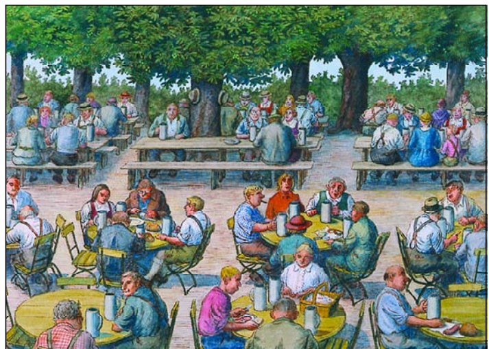
Abb. 1: Der Biergarten, eine Oase in unserer schnelllebigen Zeit (Zeichnung: ZIMNIK)

Bald schon findet sich alles in den „heiligen Biergartenbezirken“ zur „regelmäßigen Meditationsübung“ ein: die migränegeplagte Geschäftsführerin eines Schönheitssalons, der bodenständige Fahrer der städtischen Müllabfuhr, die motivierte Ich-AG-Managerin, ja selbst aufstrebende Jungstudenten konvertieren meist bereits im ersten Sommersemester zu den Regeln der bayerischen Biergärten. Nach dem Studienaufenthalt haben die dabei entstandenen Gedächtnis- und Gefühlsbilder das