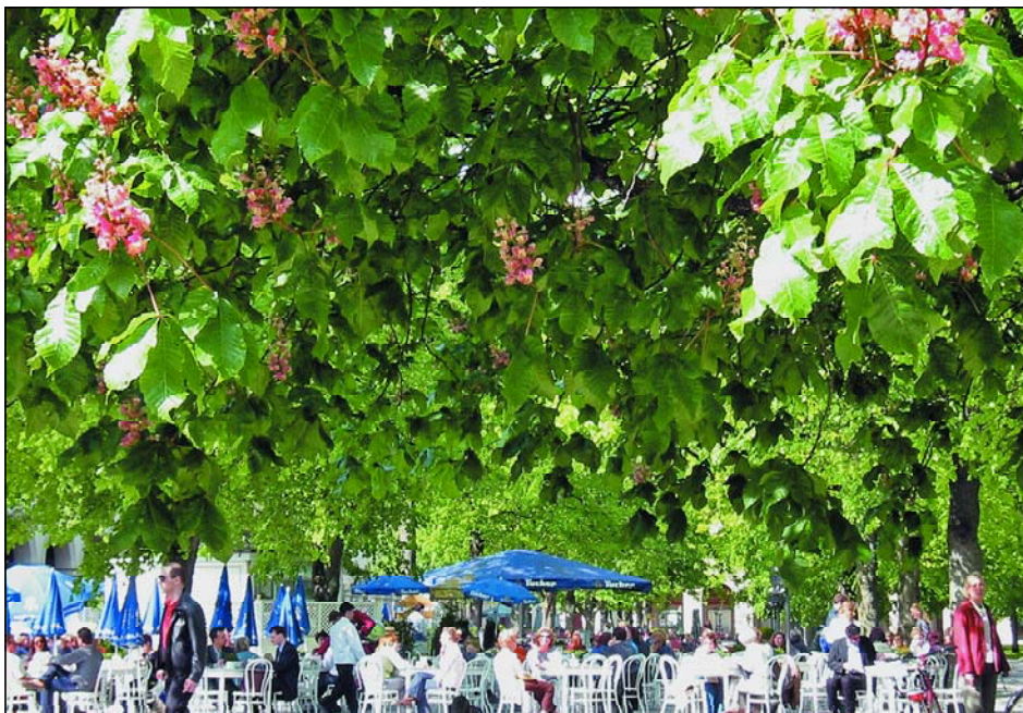
Abb. 3: Der Biergarten war, ist und wird immer ein Teil des bayerischen Kulturguts sein, mit oder ohne Kastanienwurm und Miniermotte.

trauma, das viele bis heute nicht verwunden haben. Doch nicht nur das, am meisten wurmen momentan die Einschränkungen auf Grund der eingeleiteten großen Staatsreform. Als da wären: Die Streichung von Essensmarken, die man so gern für den Biergartenkäse einlöste und die Heraufsetzung der Arbeitszeit, womit der so wichtige freitägliche Biergartennachmittag zur Einstimmung aufs Wochenende entfällt, um nur zwei geradezu existentielle Maßnahmen zu nennen.