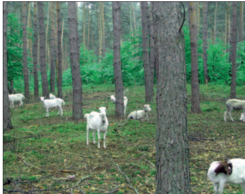
Abb. 2: Der Naturschutz hat die Waldweide als landschaftspflegerisches Element entdeckt: Ziegen im Schonwald Reilinger Eck bei Schwetzingen. Mit Hilfe der Beweidung sollen Problem-pflanzen wie Brombeere, Spätblühende Traubenkirsche und Landreitgras zurückgedrängt werden, um wieder neue Lebensmöglichkeiten für die konkurrenzschwachen Arten der Sand-Kiefernwälder entstehen zu lassen.

Neben den naturschutz- und forstfachlichen Überlegungen spielt selbstverständlich auch bei der Waldweide das Geld eine Rolle. Zumindest in den ersten Jahren fordern auch Wald-