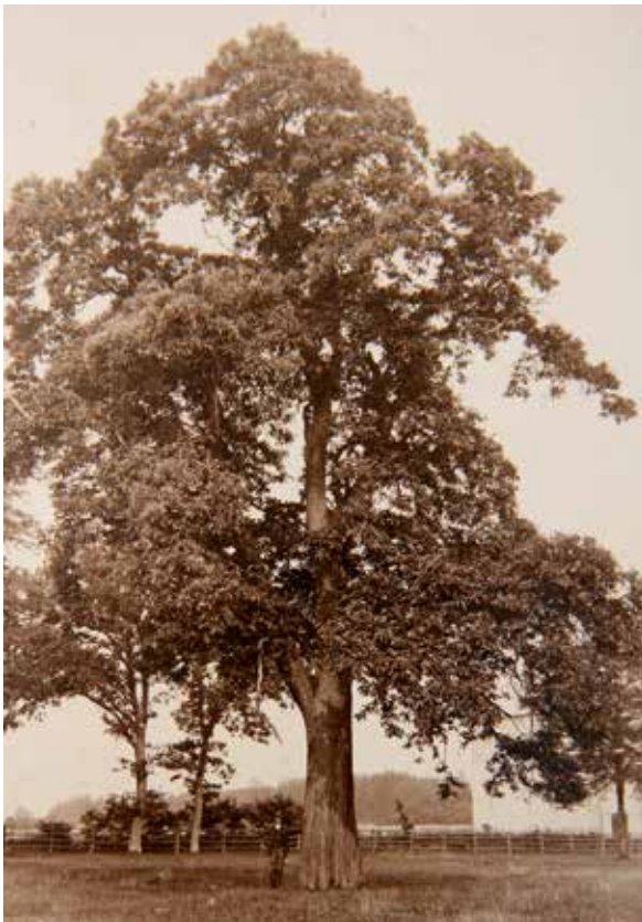
Abbildung 2: Castanea vesca in Geesthof; 200-jährig, 22,40 m hoch, 4,30 m StU (BA DDG III, E, 26)