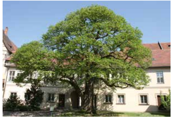
Abbildung 3: Ca. 200-jährige Edelkastanie im Garten der Dompropstei in Bamberg; mit 4,90 m StU (2018) aktueller Rekordbaum der Art in Bayern