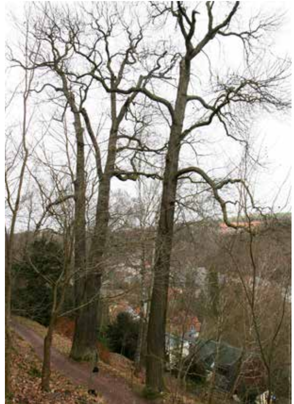
Abbildung 9: v.l. Castanea sativa (Zwiesel, 4,34 m StU, 2016) und Castanea dentata (2,61 m StU, bundesweiter Rekordbaum der Art), Forstbotanischer Garten, Tharandt/Sachsen

Dannenfels (Bouffier 2011a/b). Letzterer ist sicher einer der schönsten in Deutschland.