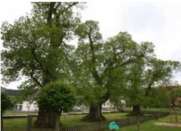
Abbildung 10: Baumgruppe aus drei Edelkastanien, Sinnershausen/Thüringen, v.l.: 5,53; 5,38 und 5,86 m StU (Foto und Messung vom 10. Mai 2014)

Baumgruppe aus drei Edelkastanien am Kindergarten (von außen einsehbar!, Abbildung 10) in Hümpfershausen, Landkreis Schmalkalden-Meiningen. Nähe Gutshof (Feuerwehrschule) Sinnershausen mit weiteren bemerkenswerten Gehölzen wie einer Tanzlinde.