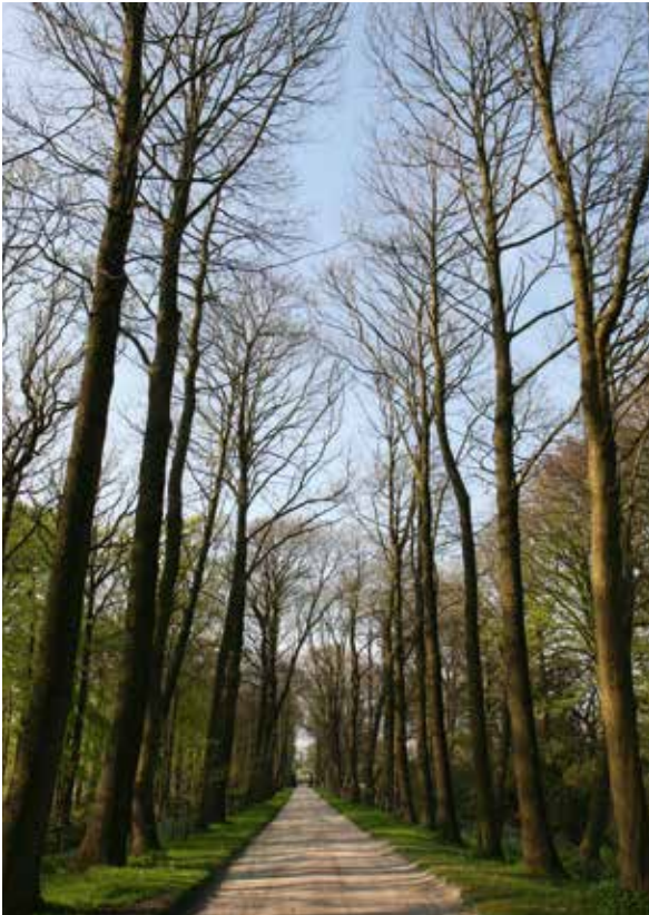
Abbildung 6: Nach dem II. Weltkrieg angelegte Allee aus Edelkastanien, Schlosspark Lütetsburg/Niedersachsen