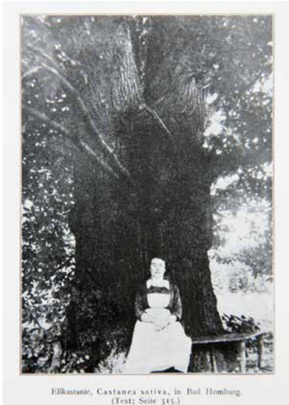
Abbildung 5a: Edelkastanie (5 m StU) im ehemaligen Garten von Oberstleutnant Hübsch (1926), (Quelle: BA DDG II, E, 12) und ...