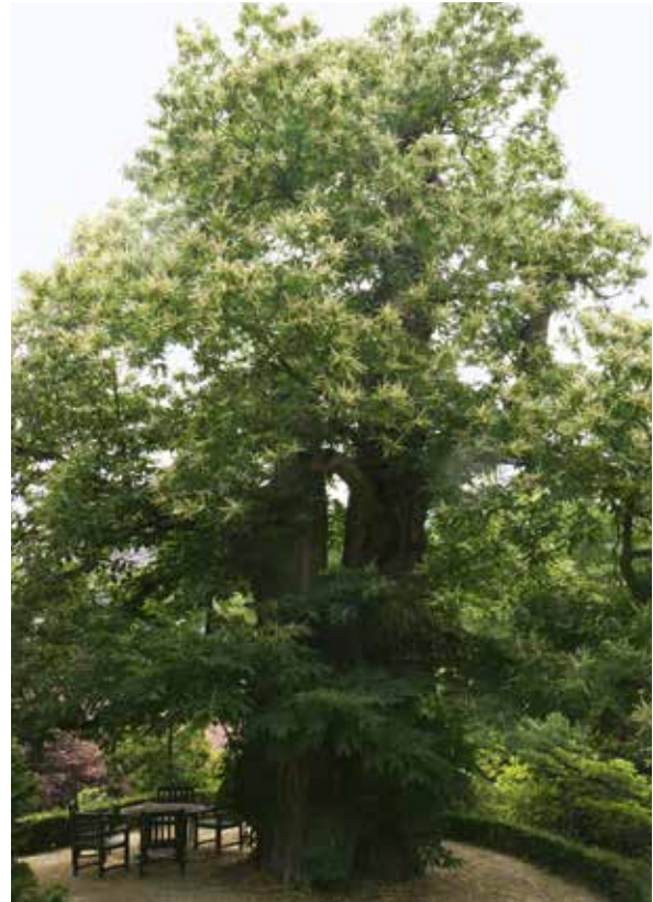
Abbildung 5b: ... derselbe Baum (7,60 m StU, 2017) heute in Reimers Garten, Bad Homburg/Hessen

Ein ehemals berühmter über 200-jähriger Kastanienhain in der Nähe des Jagdschlusses Platte (bei Wiesbaden), der durch große, weit ausladende Bäume mit tief ansetzenden Kronen gekennzeichnet war (wie Eichen im Hutewald), ist nach Aufgabe der Bewirtschaftung durch Pioniergehölze und aufkeimende Edelkastanien schließlich durch seine eigene Verjüngung ausgedunkelt und zum Absterben gebracht worden. Die ehemals obstbauliche Nutzung der gesuchten Früchte ist in eine waldbauliche Bewirtschaftung übergegangen.