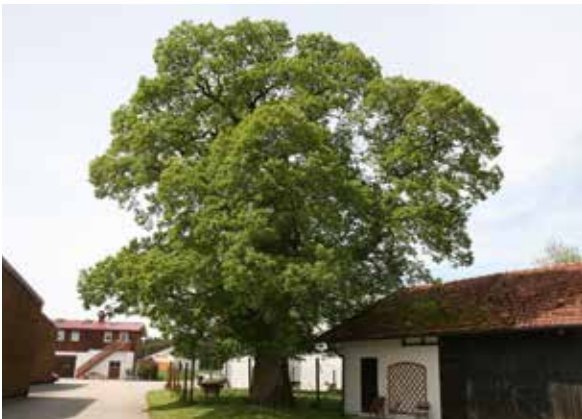
Abbildung 4: Solitäre Edelkastanie in Geisenbrunn, Landkreis Starnberg (Bayern), 4,63 m StU im Mai 2016

Eine der schönsten solitären Edelkastanien Bayerns wurde um 1870 nach Auskunft der Eigentümerin auf einem landwirtschaftlichen Hof im Ortsteil Geisenbrunn (Gemeinde Gilching) im Landkreis Starnberg gepflanzt (Abbildung 4).