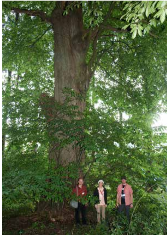
Abbildung 7: 200 bis 250-jährige Edelkastanie mit 5,65 m StU (2015), oberhalb von Schloss Schwöbber/Niedersachsen

parks, der für seine Rhododendron- und Azaleenblüte bekannt ist. So »hoch im Norden« gedeihen die Edelkastanien noch prächtig! (Abbildung 6).