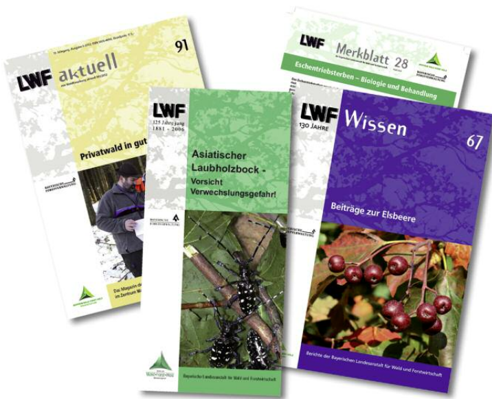
Abbildung 1: Die LWF gibt sechs Printprodukte heraus. LWF aktuell, LWF Wissen sowie Merkblätter und Falblätter der LWF waren Gegenstand einer Leserbefragung der TU München.

Im Rahmen einer Evaluierung der Printmedien der Bayerischen Landesanstalt für Wald und Forstwirtschaft (LWF) hat der Lehrstuhl für Wald- und Umweltpolitik der Technischen Universität München (TUM) in enger Zusammenarbeit mit der Abteilung »Wissenstransfer, Öffentlichkeitsarbeit, Waldpädagogik« der LWF eine telefonische Kundenbefragung durchgeführt. Befragt wurden Mitglieder der Bayerischen Forstverwaltung aus der Praxis und Geschäftsführer forstlicher Zusammenschlüsse. Die Ergebnisse zeigen, LWF aktuell und die LWF Merkblätter sind attraktive, praxisnahe, abwechslungsreiche und ansprechende Medien. Die Redaktion ist auf dem richtigen Weg.