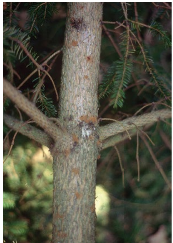
Abbildung 3: Der Kupferstecher bevorzugt die dünnrindigen Stammteile von Jungfichten bzw. Kronen oder Äste von Altlichten.