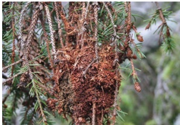
Abbildung 9: Die Larven der Fichtengespinntblattwespe bilden im Laufe ihres Fraßes sogenannte Gespinstsäcke, die gegen Ende der Larvenentwicklung mit Kot- und Nadelresten gefüllt sind und daher braun gefärbt sind.