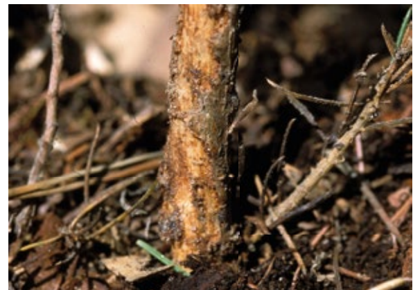
Abbildung 8: Typischer pockennarbiges Fraß des Großen Braunen Rüsselkäfers am Wurzelhals einer jungen Fichte. Verlaufen die Fraßstellen stammumfassend (Ringelung), stirbt die Pflanze ab.