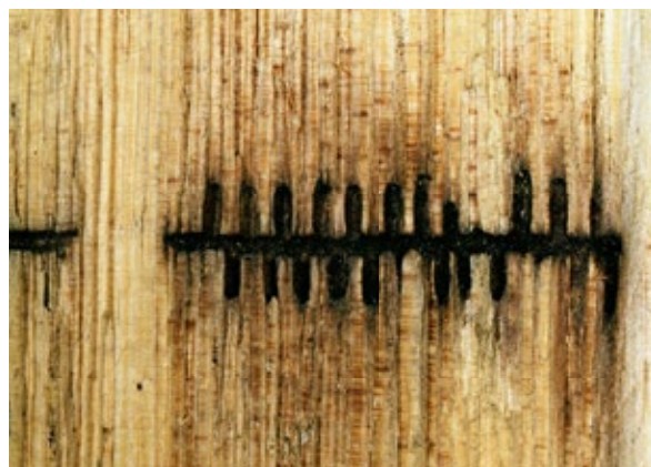
Abbildung 6: Leiterförmiges Brutbild des Nadelnutzholzborkenbohrers im Splintholz. Die Schwarzfärbung der Mutter- und Larvengänge wird durch den Ambrosia-Nährpilz verursacht, der den Larven als Nahrung dient.

einer Körpergröße von 1–1,5 mm (Schwerdtfeger 1981) deutlich kleiner als der Kupferstecher. Im Gegensatz zu diesem ist der Furchenflügelige Fichtenborkenkäfer nicht plurivoltin, sondern durchläuft nur zwei Generationen pro Jahr mit Flugzeiten im Mai und Juli/August. Geschwisterbruten sind möglich. Seiner Größe entsprechend kann er die dünnrindigsten Pflanzen befallen und ist daher als Kulturschädling, insbesondere in Trockenphasen waldschutzrelevant. Holzbrütende Borkenkäfer, hier sei exemplarisch der Gestreifte Nadelnutzholzborkenkäfer ( Trypodendron lineatum OL.) genannt, können an lagerndem Holz erhebliche technische Schäden verursachen. Als mycetophage Art benötigt der Gestreifte Nadelnutzholzborkenkäfer eine verringerte Holzfeuchte, um in seinen Brutsystemen, die bis zu ca. 10 cm radial in den Holzkörper hineinreichen können, seinen Ambrosia-Nährpilz erfolgreich