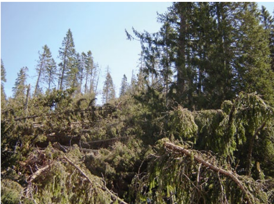
Abbildung 1: Sturmschäden, wie hier nach dem Sturm Kyrill im Jahre 2007, sind immer wieder Ausgangspunkt von Borkenkäfermassenvermehrungen. Die Fichte ist als Flachwurzler anfällig für Sturmwurfschäden.

chert und Kölling 2004; Kölling 2014). Der »ökosystemare Widerstand« (Petercord und Straßer 2017) gegen den Anbau der Fichte außerhalb ihres natürlichen Verbreitungsgebiets war bei Berücksichtigung der elementaren standörtlichen Anforderungen der Baumart beherrschbar und das Risiko ökonomisch kalkulierbar. Forstgeschichtlich betrachtet begann der gezielte Anbau der Fichte in der »Kleinen Eiszeit« (ca. 1400 bis ca. 1850) (Kölling et al. 2009) und damit in einer Klimaphase, in der insbesondere biotische Faktoren dem Anbau kaum Grenzen setzten. Allerdings finden sich auch aus dieser Phase Berichte über Borkenkäfermassenvermehrungen, die damals allerdings noch als »Wurmtrocknis« bezeichnet wurden (Gmelin 1787; Escherich 1923; Blankmeister und Hengst 1971). Interessanterweise stammen diese frühen Berichte aus Regionen, die als »Industriegebiete« des Mittelalters bzw. der frühen Neuzeit gelten. Holz war als Wirtschaftsgut in diesen Regionen von besonderem Interesse, Schäden am Wald folglich bedeutsam und berichtenswert. Gleichzeitig war der Fichtenanteil von Natur aus, oder durch die anthropogene Veränderung der Wälder, bereits groß genug für umfängliche Massenvermehrungen des Buchdruckers ( Ips typographus L.). Vor der gezielten Förderung der Fichte ab Ende des 18. Jahr-