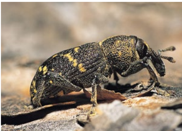
Abbildung 7: Großer Brauner Rüsselkäfer. Der kräftig gebaute, braune Käfer gehört zu den gefährlichsten Kulturschädlingen der Fichte.

zu kultivieren (Abbildung 6). Die Art befällt daher in der Regel nur lagerndes Holz. Stehendbefall ist in ausgesprochenen Trockenperioden, wie beispielsweise im Sommer 2003 möglich und wird damit zukünftig wahrscheinlicher. Das Brutsystem besteht aus einer kurzen Eingangsröhre und gabelt sich dann in meist zwei Muttergänge auf. Das Weibchen nagt abwechselnd in den Gangboden und die Gangdecke einischen, in die jeweils ein Ei abgelegt wird. Die Larven erweitern diese Einischen im Laufe ihrer Entwicklung zu kurzen Larvengängen, die letztlich auch als Puppenwiegen dienen. Diese Larvengänge sind ca. 5 mm lang und verlaufen in Faserrichtung. So entsteht das typische Fraßbild eines einholmigen Leitergangs. Die Elterntiere betreiben eine umfangreiche Brutpflege, in dem sie den Nährpilz im Gangsystem während der Entwicklung der Larven pflegen und für eine ausreichende Belüftung des Systems sorgen (Petercord 2011). Geschwisterbruten sind daher ausgeschlossen. Die vollständig entwickelten Jungkäfer verlassen das Brutsystem über das Einbohrloch und überwintern in der Bodenstreu (Schwerdtfeger 1981). Es wird pro Jahr eine Generation durchlaufen (Schwerdtfeger 1981), es gibt allerdings Hinweise auf eine mögliche zweite Generation (Parini und Petercord 2006). Da die Art zu den Frühschwärmern zählt und Befall bereits Ende März beobachtet werden kann, sind entsprechende Waldschutzmaßnahmen sehr früh im Jahr notwendig.