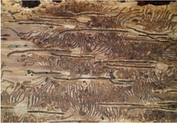
Abbildung 4: Das Brutsystem des Buchdruckers ähnelt einem aufgeklappten Buch, daher auch der Name »Buchdrucker«. Vom Muttergang gehen seitlich die Larvengänge ab, die in den Puppenwiegen münden.