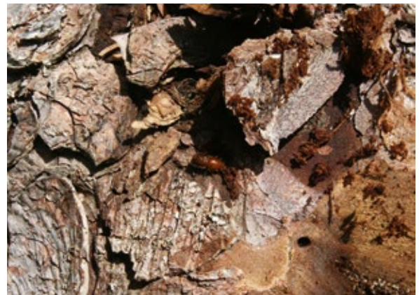
Abbildung 2: Buchdrucker bohren sich zur Brutanlage ein. Dabei entsteht das typische, »schnupftabakähnliche« braune Bohrmehl.

Pfeffer (1995) führt 39 Borkenkäferarten auf, die Fichten als Wirtspflanzen nutzen. Die Einnischung dieser Arten als Rinden-, Holz- oder Wurzelbrüter mit artspezifischen Anforderungen zur Vermeidung, respektive Reduzierung interspezifischer Konkurrenz um die Nahrungsressource, ist beispielhaft. Borkenkäfer sind grundsätzlich Sekundärschädlinge, das heißt sie be-