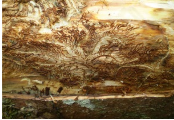
Abbildung 5: Die sternförmig ausgerichteten Muttergänge des Kupferstechers gehen von einer in der Rinde versteckten Rammelkammer aus. Die Verpuppung erfolgt in den Puppenwiegen in der Rinde.