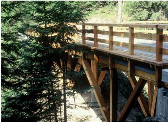
Abbildung 5: In Ingenieurbauweise ausgeführte Holzbrücke in einem Naturschutzgebiet; im Brückenbau gehört die Lärche auf Grund ihrer großen Tragfähigkeit und hohen natürlichen Dauerhaftigkeit zu den bevorzugten Holzarten.

Als Bau- und Konstruktionsholz bietet sich Lärche vor allem für hochbeanspruchte Konstruktionen an – im Außenbereich für den Erd-, Brücken- und Wasserbau (Abbildung 5), im Innenbereich für Dachtragwerke,