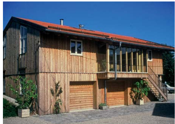
Abbildung 7a und b: Wohnhäuser aus Holz unter vielfältiger Verwendung der dauerhaften Lärche unter anderem für die Außenbekleidungen, Balkone, Türen und Tore

Wand- und Deckenkonstruktionen. Im Haus- und Wohnungsbau lässt sich Lärche im Außenbereich vorteilhaft für Rahmenkonstruktionen, Fassadenelemente, Brüstungen, flächendeckende Bekleidungen von Wänden, Balkonen, Dachüberständen und Giebeln sowie für Haustüren, Garagentore und Fenster verwenden (Abbildungen 6 bis 8). Darüber hinaus gehört Lärche zu den bevorzugten Holzarten für die Herstellung von Dachschindeln (Abbildung 9). Ein Sprichwort in der Schweiz sagt: „Lärchenschindeln haben keinen Tod“. Im Innenbereich findet sie als Bautischlerholz bzw. dekoratives Ausbau- und Ausstattungsholz Verwendung unter anderen für Treppen, Parkett- und Dielenböden, Decken- und Wandbekleidungen sowie Einbauten. Desweiteren kommt Lärchenholz als Vollholz und Furnier im Möbelbau zum Einsatz. Insbesondere werden gerne Küchenmöbel, Bauernmöbel bzw. Möbel im alpenländischen Stil, Eckbänke mit zugehörigen Tischen und dergleichen daraus hergestellt.