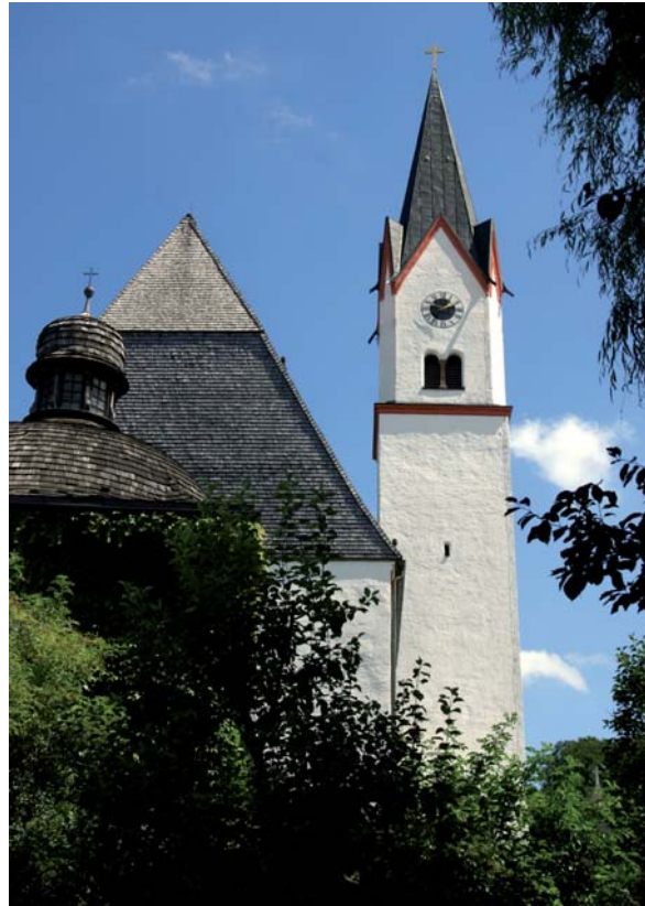
Abbildung 9: Dauerhaft, landschaftsprägend und von hoher Ästhetik: Schindeln aus Lärchenholz