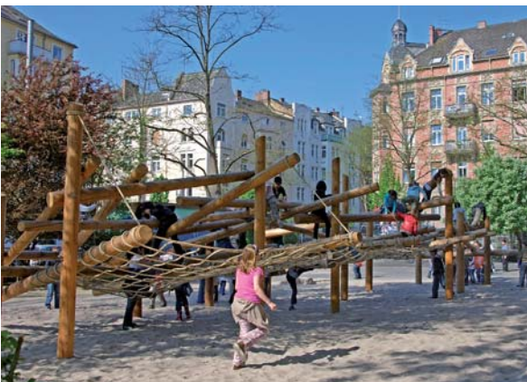
Abbildung 10: Kletterstruktur auf einem Kinderspielplatz aus dem dauerhaften Holz der Lärche – Holzschutzmittel überflüssig. Wer mag hier nicht spielen?

Zu den speziellen Verwendungsbereichen des Lärchenholzes gehört auf Grund seiner hohen Resistenz gegen Chemikalien die Herstellung von Fässern, Bottichen und sonstigen Behältern für chemische Lösungen. Des-