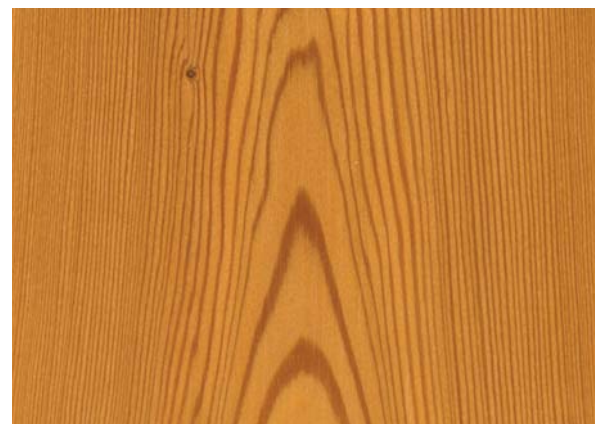
Abbildung 2: Holz der Lärche (Fladerschnitt)

Das gegenüber dem hellfarbigen Frühholz wesentlich dunklere bis tiefbraune Spätholz ist sowohl an der Jahrgrenze als auch innerhalb der Jahrringe – und somit beidseitig – scharf vom Frühholz abgesetzt (Abbildungen 3 und 4). Der innerhalb der Jahrringe abrupte Übergang vom Früh- zum Spätholz stellt ein weiteres kennzeichnendes Merkmal des Lärchenholzes dar. Der ausgeprägte Farbunterschied zwischen Früh- und Spät-