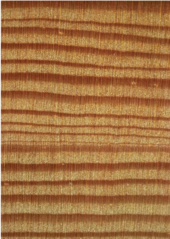
Abbildung 3: Lärche, Querschnitt; Lupenbild im Maßstab 6:1