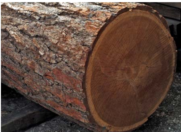
Abbildung 1: Stamm einer Lärche mit relativ schmalen hellfarbigem Splintholz und deutlich abgesetztem Farbkern

Zusammenfassung: Beschrieben werden das Holzbild sowie die Eigenschaften und Verwendungsbereiche der Lärche ( Larix decidua Miller). Als Kernholzbaum liefert die Lärche einen schönfarbigen rötlich braunen, an der Luft bis dunkelrot braun nachdunkelnden Farbkern. Mit einer mittleren Rohdichte ( r_N ) von 0,60 \text{ g/cm}^3 liefert sie das schwerste und zugleich härteste einheimische Nadelholz (mit Ausnahme der Eibe). Ihrer hohen Rohdichte entsprechend weist Lärchenholz gute elasto-mechanische Eigenschaften auf. Zu ihrer hohen Tragfähigkeit gesellt sich eine hohe Witterungsbeständigkeit. Zudem ist sie in hohem Maße resistent gegenüber Chemikalien. Auf Grund ihre guten Festigkeitseigenschaften und hohen Witterungsfestigkeit einerseits sowie ihres dekorativen Aussehens andererseits liefert Lärche sowohl ein hervorragendes, vielseitig einsetzbares Bau- und Konstruktionsholz für den Außen- und Innenbereich als auch ein geschätztes Ausstattungsholz. Zu den speziellen Verwendungsbereichen der Lärche gehören unter anderen die Herstellung von Schindeln, von Geräten für Kinderspielplätze, von Fässern und Bottichen zur Lagerung und zum Transport von festen Chemikalien und chemischen Lösungen sowie der Bau von Kühltürmen und Silos.