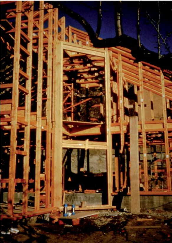
Abbildung 8: Ständer- und Skelettbauweise in Lärchenholz