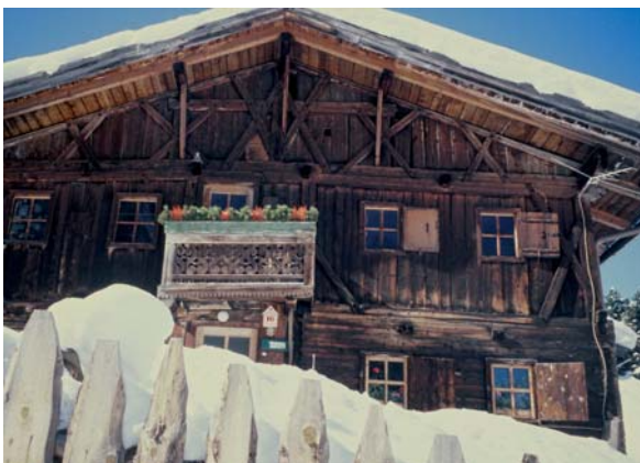
Abbildung 6: Im voralpinen und alpinen Raum mit seinen natürlichen Lärchenvorkommen kennt man seit eh und je die hervorragende Eignung des Lärchenholzes als Bauholz für Außenwände, Dachkonstruktionen, Bekleidungen, Balkone und dergleichen. (Foto: Archiv Holzforschung München).