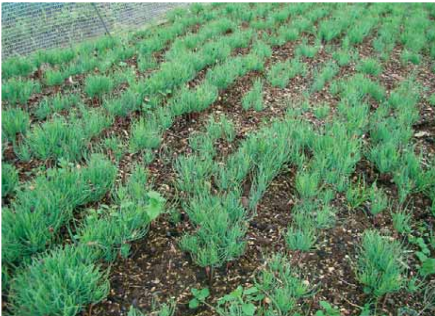
Abbildung 4: Gelbkiefer ( Pinus ponderosa ) im Quartier

Während einerseits noch die Verfügbarkeit des Saatgutes für einen Teil der neuen Versuchsanbauten geprüft wird, ist das Saatgut für einen Teil der „Neuen“ bereits aufgelaufen (Abbildung 4 Gelbkiefer, Pinus ponderosa ). Letztendlich ist geplant, mit ihnen mindestens fünf Anbauflächen mit jeweils sechs Baumarten (vier Nadel- und zwei Laubbaumarten) zu bestücken. Für die eigentliche Auswahl der Anbauorte ist es besonders wichtig, den erwarteten Klimawandel vorwegzunehmen (Simulation der zeitlichen Entwicklung mit Hilfe räumlicher Entfernung). Anbauorte, an denen bereits heute zu dem in den prospektiven Anbauregionen zukünftig herrschenden Klima ähnliche Verhältnisse herrschen, sind zu bevorzugen. Will man die Anbaueignung für die Untermainebene bestimmen, müssen die Versuchsanbauten dafür z. B. im Wallis (Schweiz) oder im Burgenland (Österreich) liegen. Die Auswahl von Versuchsflächen mit mittleren Bodenverhältnissen kann die unterschiedlichen Substratansprüche der Baumarten weitgehend ausgleichen.