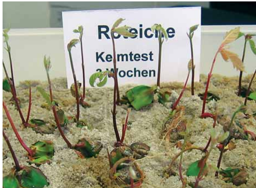
Abbildung 3: Keimtest bei Roteiche

genden nur die wichtigsten Aspekte kurz zusammengefasst.