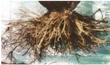
Wurzelwerk eines ca. 35-jährigen Bergahorns aus Lochhügelpflanzung. Zahlreiche, kräftige Vertikalwurzeln drängen in die Tiefe.