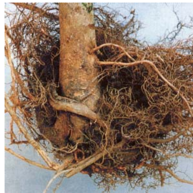
Hauptwurzel einer stark zurückgeschnittenen Esche, die zudem auf den Boden des Bohrlochs aufgestaucht wurde.