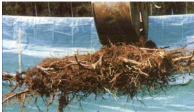
Wurzelwerk eines etwa gleichaltrigen Bergahorns aus Winkelpflanzung auf gleichem Standort. Die Wurzeln verlaufen einseitig und flach, nicht nach unten gerichtet.