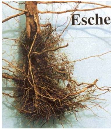
Esche vor fünf Jahren mit dem Pflanzlochbohrer auf bindigem Boden und zu kleinem Bohrdurchmesser eingebracht. Folge: Blumentopfeffekt; Sekundärwurzelsystem am Wurzelhals im humosen Oberboden.