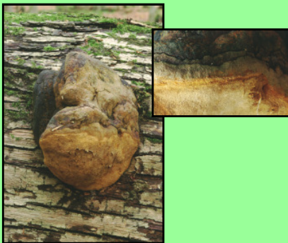
Eichenfeuerschwamm Phellinus robustus