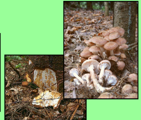
Hallimasch Armillaria sp.