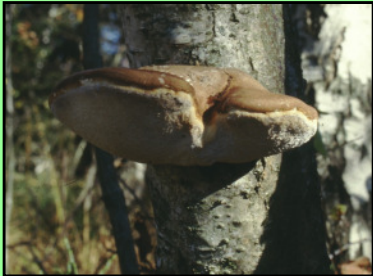
Birkenporling Piptoporus betulinus