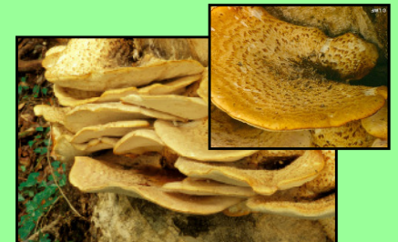
Schuppiger Porling Polyporus squamosus