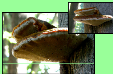
Zottiger Schillerporling Inonotus hispidus