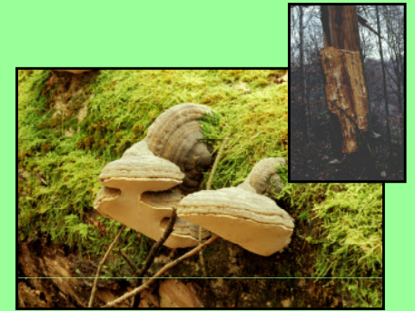
Zunderschwamm Fomes fomentarius