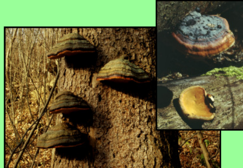
Rotrandiger Baumschwamm Fomitopsis pinicola