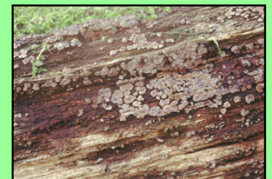
Mosaikschichtpilz Xylobolus frustulatus