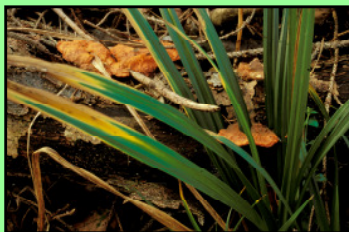
Zinnoberrote Tramete Pycnoporus cinnabarinus