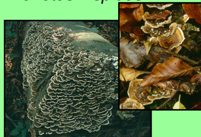
Schmetterlingstramete Trametes versicolor