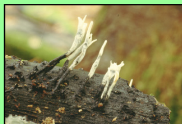
Geweihförmige Holzkeule Xylaria hypoxylon