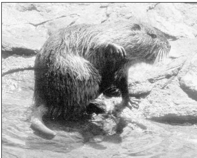
Abb. 2: Nutria

Der Nutria, auch Sumpfbiber genannt, ist deutlich kleiner als der Biber, aber größer als der Bisam. Die Art stammt aus Südamerika. Dort ist sie vom südlichen Brasilien bis nach Feuerland verbreitet. In Europa wurde der Nager zunächst seines Pelzes, aber auch seines Fleisches wegen in Farmen gezüchtet. Um Fischteiche von allzu reichem Pflanzenwachstum zu befreien, setzte man die Art dann in der Camargue in Südfrankreich aus. Der Versuch erwies sich als äußerst erfolgreich, so dass in den 70er Jahren bereits rund 30.000 Tiere gezählt wurden. Andere Aussetzungen unter klimatisch ungünstigeren Bedingungen schlugen dagegen fehl,