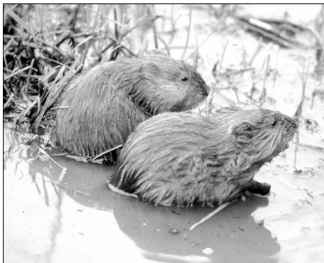
Abb. 1: Bisam