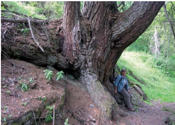
Abbildung 2: Alte und mächtige, mehrstämmige Lärche in Lavin, Graubünden