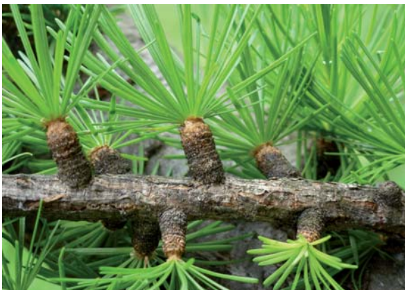
Abbildung 3: Ältere Kurztriebe von Larix decidua

Das stark disjunkte Areal hat zur Ausbildung geografischer Rassen geführt, die sich in morphologischen und ökophysiologischen Merkmalen unterscheiden (z. B. Wüchsigkeit, Wuchsform, Anfälligkeit gegenüber Krankheiten). Früher hat man diese Klimarassen als die Unterarten Alpenlärche ( L. decidua ssp. decidua ), Sudetenlärche (ssp. sudetica ), Karpatenlärche (ssp. carpatica ) und Polenlärche (ssp. polonica ) unterschieden. Nach neuerer Auffassung (Farjon 2010) unterteilt man die Art nur noch in die drei Varietäten L. decidua var. decidua , var. carpatica und var. polonica .