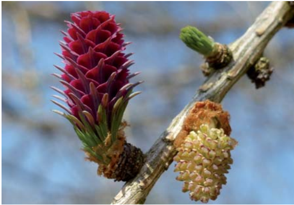
Abbildung 6: Weiblicher Blütenstand (links) und männliche Blüte von Larix decidua

knospe ab und können daraus Jahr für Jahr einen Büschel Nadeln bilden. Die Langtriebbildung ist ausgeprägt akroton (spitzenwärts) gefördert, das heißt, je näher sich ein Kurztrieb zur jeweiligen Sprossspitze befindet, um so wahrscheinlicher wird er zum Langtrieb und desto stärker ist sein Längenwachstum. So werden die Endknospen an der Spitze eines Zweiges am häufigsten zu Langtrieben, während Triebe im mittleren und basalen Teil einer Sprossachse, insbesondere im Kroneninneren, am längsten im Kurztriebstadium verharren. Langtriebe bilden sich deshalb bevorzugt an der Peripherie der Krone und im Wipfelbereich, was zu einer raschen Vergrößerung der Krone und vor allem in der Jugend zu stärkerem Höhenwachstum führt.