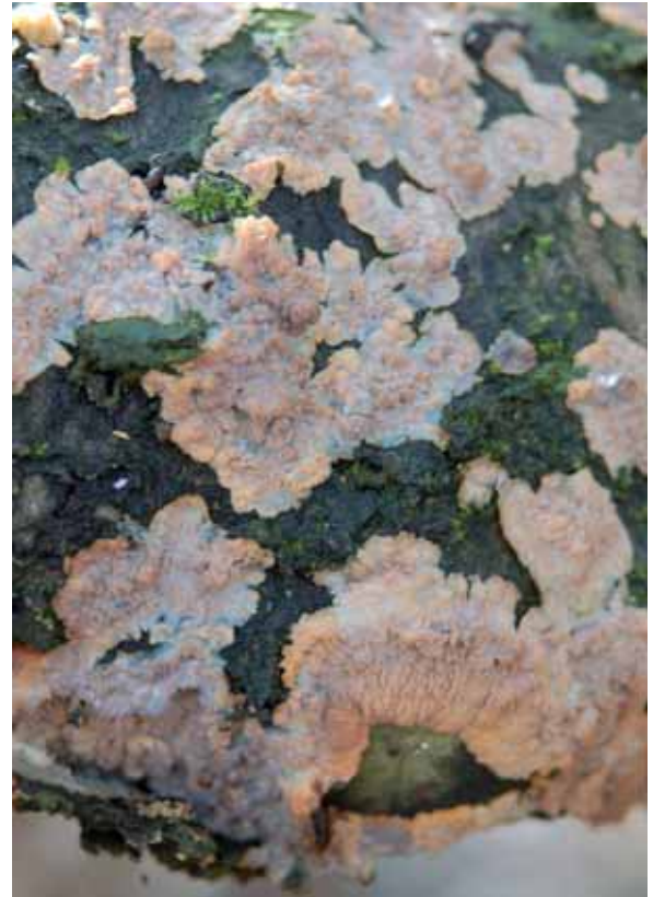
Abbildung 7: Orangefarbener Kammpilz ( Phlebia meresmoides )

Hexenbesen treten auch an Kirschbäumen vereinzelt auf. Sie werden dann meistens von einem sehr urtümlichen Schlauchpilz mit freien Sporenschläuchen, Taphrina cerasi , gebildet (Butin 1996).