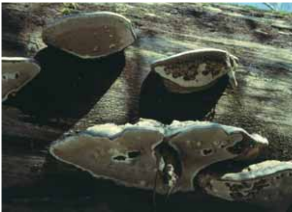
Abbildung 6: Flacher Lackporling Ganoderma lipsiense