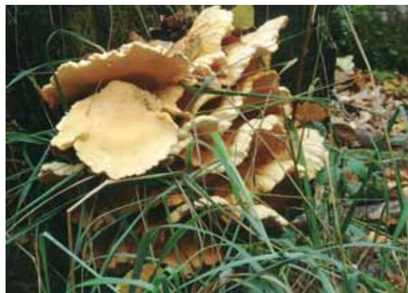
Abbildung 3: Schwefelporling Laetiporus sulphureus

Nach einem feuchten Frühjahr platzen häufig die Kirschen auf. Verschiedene Schimmelpilze besiedeln die dann freiliegende Fruchtschicht. Dabei spielt die Grauschimmelfäule ( Botrytis cinerea ) eine wesentliche Rolle. Der Pilz ist ein Universalist, der an zahlreichen Baum- und Straucharten zu finden ist. Dabei befällt er häufig die noch weichen Blätter und von dort die jungen, unverholzten Triebe. Die typischen rhombusförmigen Nekrosen, insbesondere um alte Astwunden, verursachen Pilze der Gattung Nectria ( N. ditissima oder N. gallica ).