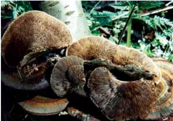
Abbildung 5: Rötende Tramete Daedaleopsis confragosa