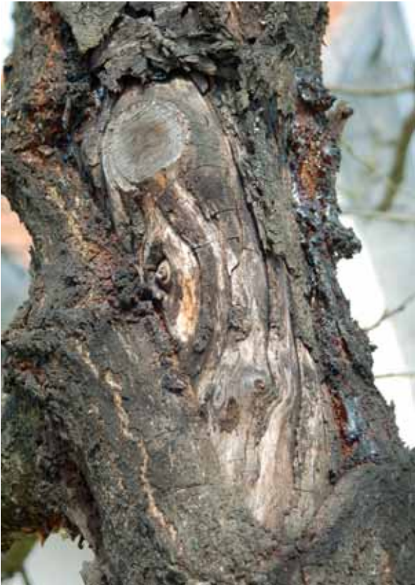
Abbildung 1: Von einer Nectria -Art ( Nectria sp.) verursachter Stammkrebs