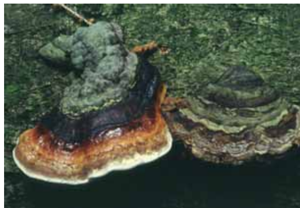
Abbildung 4: Rotrandiger Baumschwamm Fomitopsis pinicola

Am Stammfuß von Kirschbäumen können sich Zellulosepilze ansiedeln (Rüegg und Bolay). Die Pilze der Gattung Phytophthora infizieren bevorzugt zunächst vom Boden aus die Wurzeln und breiten sich dann im Kambium bis in den Stamm aus. Aber auch verschiedene Hallimascharten ( Armillaria sp.) können sich im Kambium der Kirschbäume etablieren und einen raschen Tod der Bäume herbeiführen.