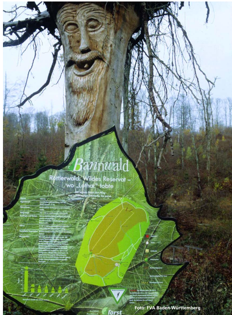
Abbildung 4: »Waldschräte«, ergänzt mit Informationstafeln, laden zum Besuch eines Bannwaldes ein. Sie stehen allerdings außerhalb. Im Bannwald selbst werden schon aus Gründen der Verkehrssicherheit keine Tafeln aufgestellt. Die vermittelten Informationen sollen dazu anregen, selbstständig Wald zu erleben, Pflanzen und Tiere zu entdecken und Entwicklungsprozesse im Wald zu verstehen.