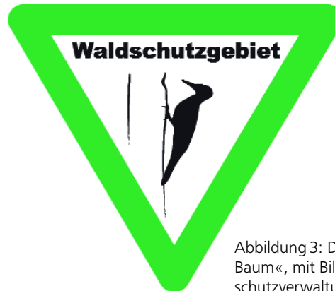
Abbildung 3: Der »Specht am Baum«, mit Billigung der Natur-schutzverwaltung dem Natur-schutzgebietsschild nachgestaltet, verweist auf eine entscheidende waldspezifische Eigenschaft der Waldschutzgebiete: Totholz als Lebensraum.

Bemerkenswert ist, dass sehr unterschiedliche Pilz- und Totholzkäfergemeinschaften regional klimatisch, standörtlich und strukturell ähnliche Gebiete bewohnen. Neben vielen gemeinsamen Arten leben offenbar getrennt nach Raum und Zeit auch sehr viele verschiedene Arten (Bense 2006). Jedes Gebiet scheint seinen eigenen Charakter zu besitzen und lässt sich deshalb nicht ohne weiteres mit anderen vergleichen. Man darf also nicht erwarten, dass ein einzelner Bannwald schon »repräsentativ« für eine ganze Region ist. Hier besteht noch erheblicher Forschungsbedarf. Möglicherweise war die lokale Wald- und Bestandesgeschichte verschieden. Vielleicht liegt es an der mangelnden Vernetzung der Gebiete in unserer »Kultur- und Zivilisationslandschaft«, die die Rückwanderung »verlorener« Arten erschwert, bei den Urwaldreliktarten vielleicht sogar unmöglich macht.