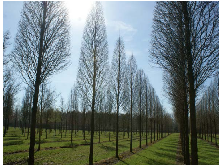
Als Alleebäume erzogene Hainbuchen im Baumschulquartier

Die Ausgaben für Gehölze pro Jahr und Kopf in Deutschland liegen bei knapp 20 Euro.