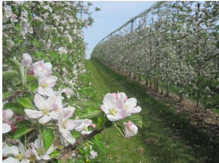
Äpfel werden in Bayern auf dem größten Flächenumfang aller Obstkulturen angebaut und sind die beim Verbraucher beliebteste Obstart