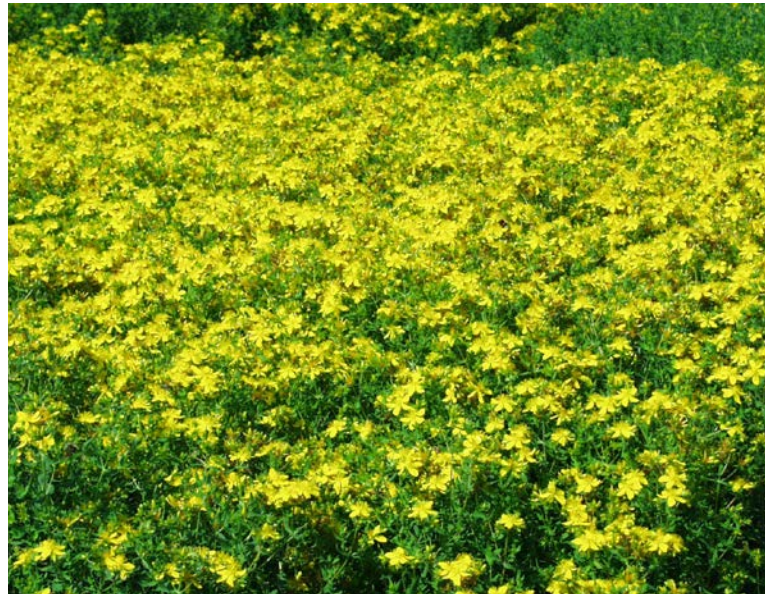
Johanniskraut – eine wichtige Arzneipflanze für die Herstellung pflanzlicher Antidepressiva

Schwerpunktgebiete liegen u.a. in den Räumen Erding, Straubing, Eichstätt, Neuburg, Donauwörth, Augsburg, Ansbach, Erlangen und Schweinfurt. Im mittelfränkischen Landkreis Erlangen-Höchstädt (um Baiersdorf) existiert das größte zusammenhängende Meerrettichanbaugesamt in Deutschland für Kren (Meerrettich) mit rund 100 Hektar. Auch der Anbau von Hopfen (mit bayernweit rund 17.000 Hektar) in der Hallertau und um Spalt erfolgt zu Teilen für die pharmazeutische Industrie.