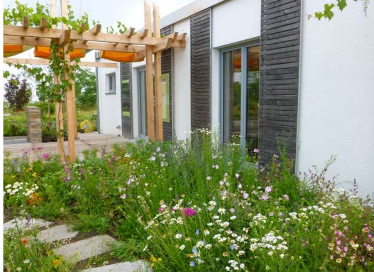
Artenreiche Ansaaten in Gärten schaffen Lebensraum für Insekten

Der Beruf Gärtner/-in erzielt bayernweit die höchsten Ausbildungszahlen unter den Agrarberufen. Von rund 5.000 Auszubildungsverhältnissen pro Jahr entfallen rund 2.000 auf diesen Beruf, wovon wiederum 1.400 Verhältnisse nur auf die Fachrichtung Garten- und Landschaftsbau entfallen.