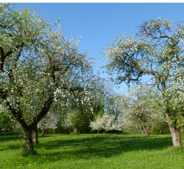
Hochstämme in Streuobstanlagen bieten Lebensraum und liefern Obst, das zu großen Teilen verarbeitet statt frisch verzehrt wird