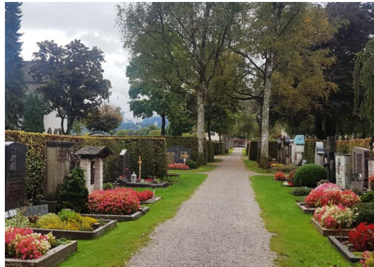
Typisch für Bayerns Friedhöfe: Üppige, saisonal angepasste Bepflanzung wie hier zum Beispiel mit Gottesaugen (Eisbegonien)