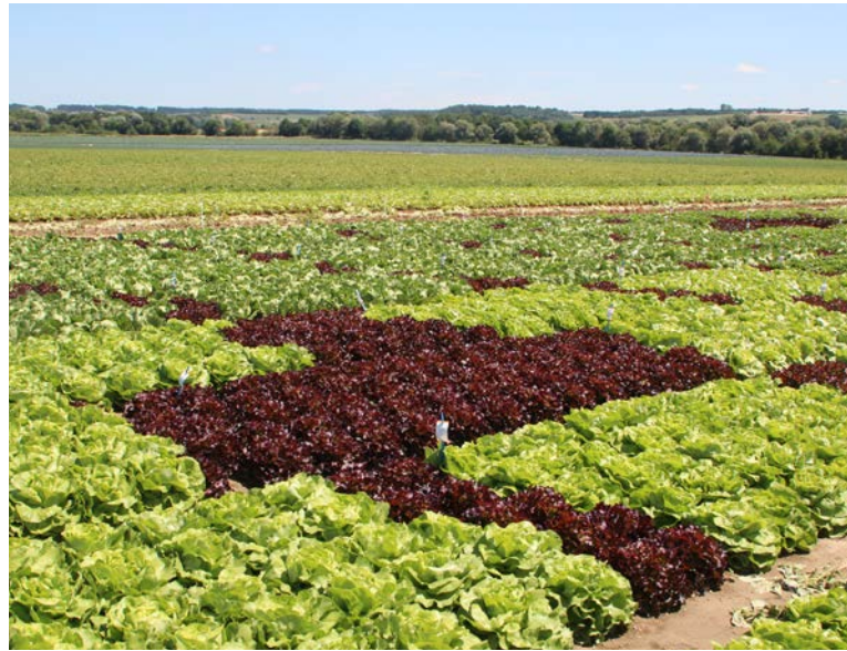
Versuchsanbau von Salaten mit unterschiedlicher Laubfärbung

Der Anbau von Kernobst findet in großem Umfang am Bodensee um Lindau und über ganz Unterfranken verteilt statt. Süßkirschen werden insbesondere um den Landkreis Forchheim (siehe auch „Baumschule“) angebaut. Der Zwetschgenanbau ist traditionell mit dem Weinbau in Unterfranken verbunden. Streuobstanbau gibt es im gesamten Land, mit Schwerpunkt am bayerischen Untermain und in den Erwerbsobstbauregionen.