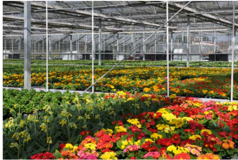
Primeln, Pelargonien (Geranien) und Poinsettien (Weihnachtssterne) - diese Arten gehören zu den wichtigsten Kulturen im bayerischen Zierpflanzenbau

In Staudengärtnereien werden winterharte, krautige Pflanzen, Gräser und Farne, sog. Stauden angebaut. Große, indirekt absetzende Staudengärtnereien finden sich in den fränkischen Regierungsbezirken. Die Ausgaben für Blumen, Zierpflanzen und Gehölze pro Jahr und Kopf in Deutschland liegen bei rund 105 Euro.