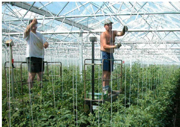
Der Deutschen liebste Gemüse, die Tomate, wird im Gewächshaus angebaut.

Insgesamt werden im Produktionscluster „Bayerischer Gemüsebau“ Umsätze von 4,4 Milliarden Euro jährlich getätigt. Knapp 10 Prozent davon entfallen auf die Produktionsstufe (heimische Gemüseerzeugung) und knapp 90 Prozent auf den nachgelagerten Bereich (Handel).