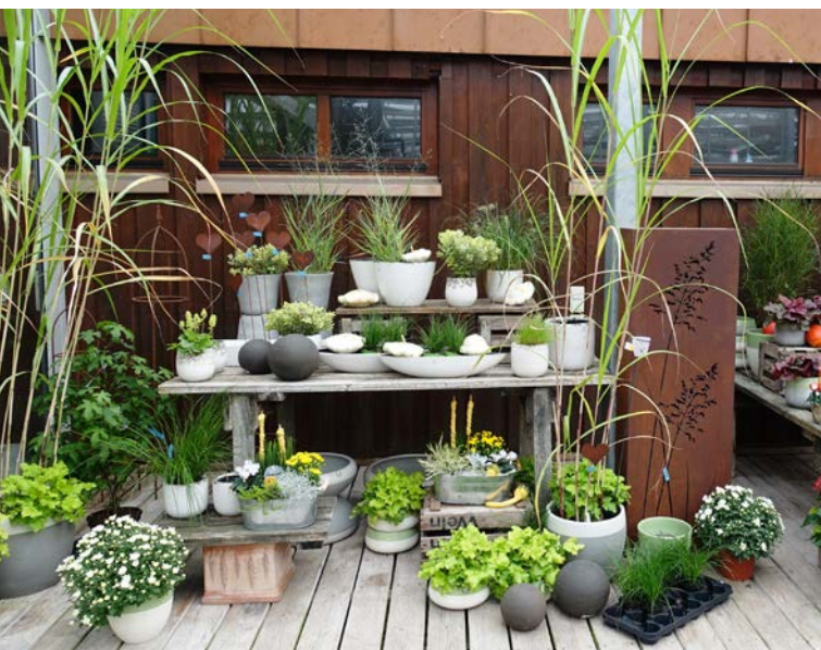
Typisch bayerisch: Der Großteil der bayerischen Betriebe baut seine Zierpflanzen selber an und verkauft sie an den Endverbraucher. Jede größere Gemeinde verfügt über eine solche Gärtnerei.

Ein Großteil der Zierpflanzen- und Baumschul-Betriebe (siehe „Zierpflanzenbau und Staudengärtnerei“ und „Baumschule“) verkauft selbst erzeugte Pflanzen mit ergänzender Handelsware direkt an den Endverbraucher. Viele größere Gartencenter sind aus Gärtnereien und Baumschulen erwachsen.