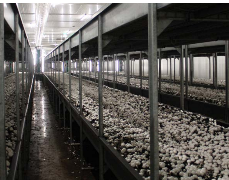
Bayerns bedeutendster Kulturspeisepilz, der Champignon, im zweilagigen Anbau

Der Pro-Kopf-Verbrauch an Gemüse in Bayern beträgt rund 70 Kilogramm pro Jahr an Frischgemüse und rund 40 Kilogramm pro Jahr an verarbeitetem Gemüse. Der Gemüse-Selbstversorgungsgrad in Bayern liegt seit Jahren bei rund 35 Prozent. Um den Bedarf zu decken, muss Gemüse – insbesondere aus Spanien und den Niederlanden – eingeführt werden. Das Lieblingsgemüse in Deutschland ist die Tomate.