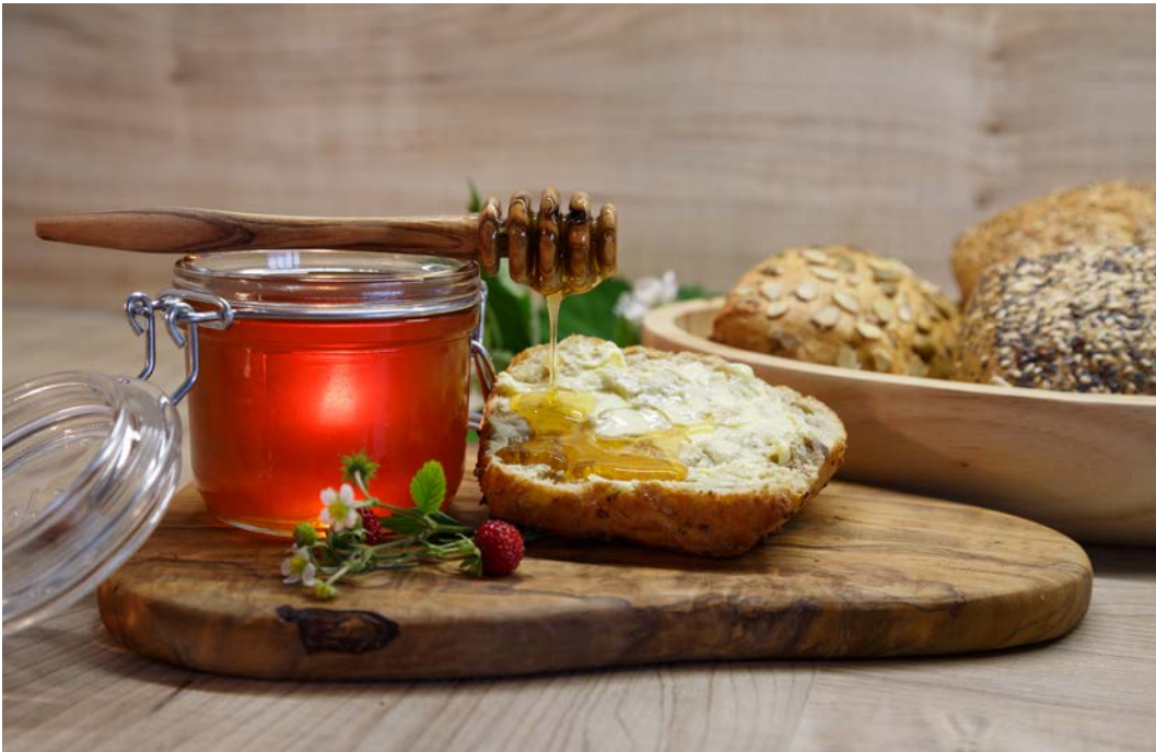
Goldener Honig – neben der Bestäubungsleistung das wichtigste Bienenprodukt