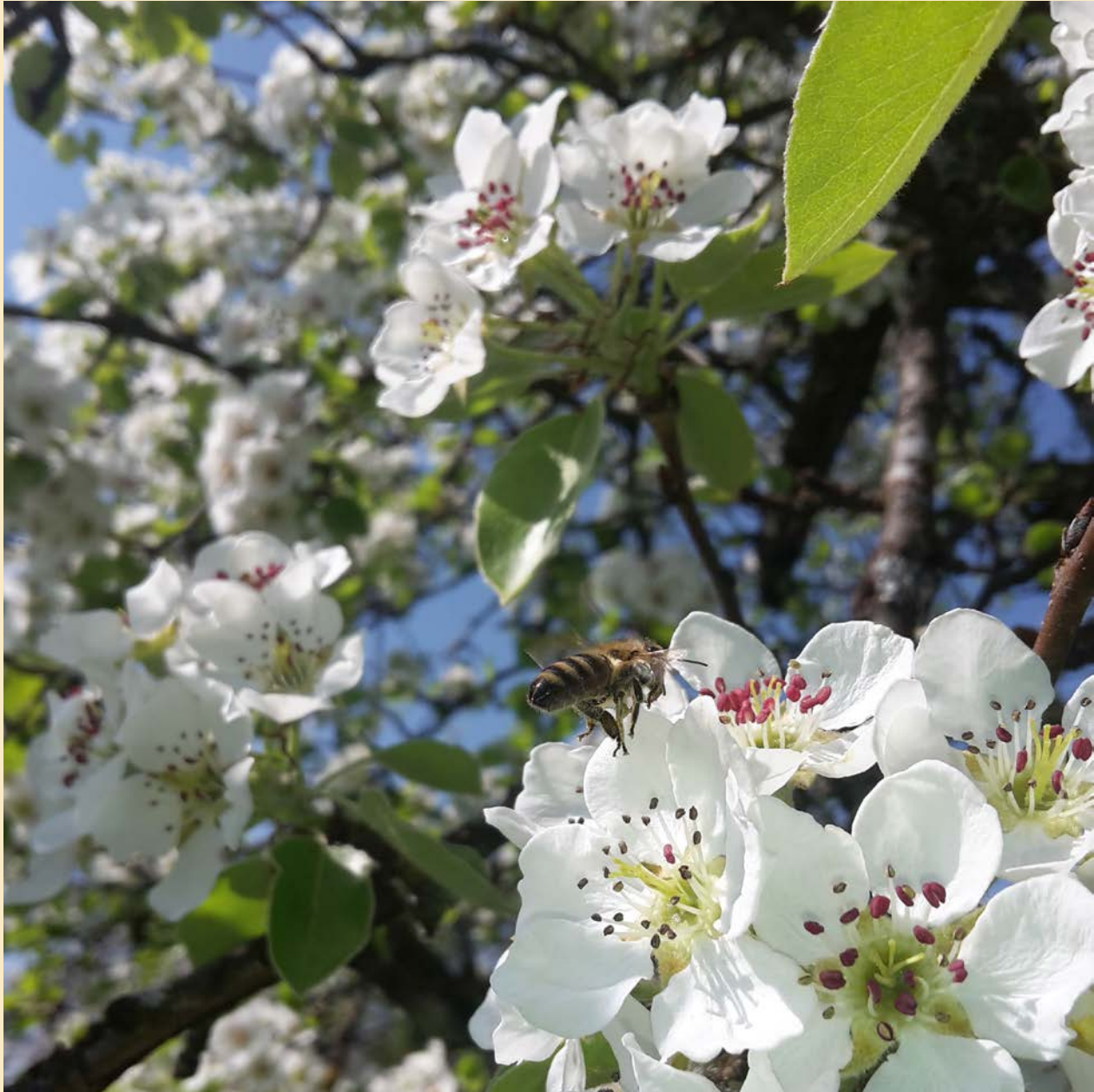
Die Bestäubung durch Bienen ist im Obstbau unverzichtbar