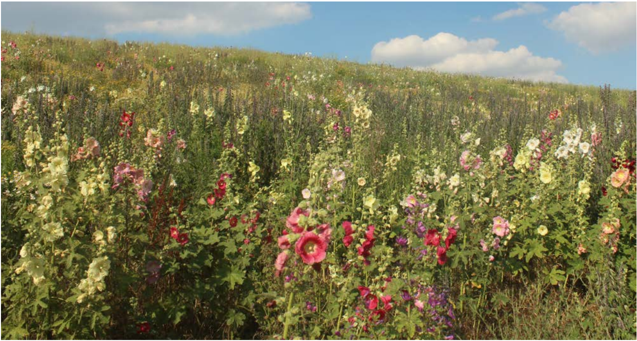
Hanfmix im vierten Standjahr

Erntetermin, unter Berücksichtigung der Brut- und Setzzeiten, zuverlässig nach dem 15. Juli zu legen. Der Präriemix, mit mehrheitlich spätblühenden, nordamerikanischen Arten, steht ab Juli in der Hauptblüte mit Erntezeit im Herbst, zeitgleich mit dem Mais.