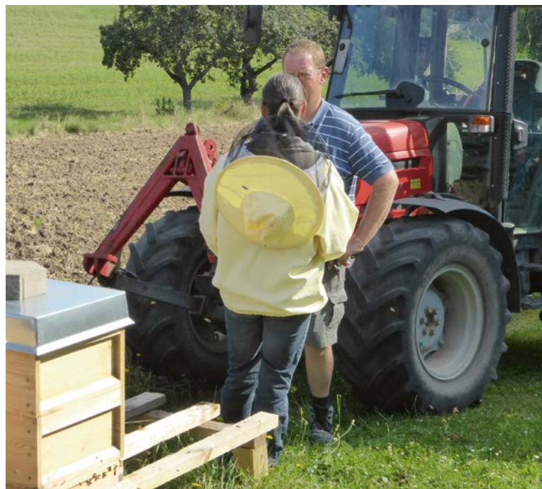
Ein persönliches Gespräch hilft, das Verständnis für die jeweils andere Seite zu verbessern.

Aufbereiter und Mulchgeräte führen nach den Ergebnissen verschiedener Publikationen zu deutlichen Verlusten lebender Insekten. Einfache Scheuchvorrichtungen könnten diese Verluste reduzieren. In einer Metastudie erwiesen sich zeitweilig ungemähte Streifen als sehr effizient, um großflächigen Nahrungs- und Lebensraumverlust für Insekten zu mindern.