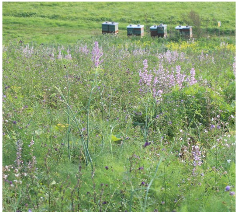
Im September bringt der Hanfmix eine schöne Nachblüte.