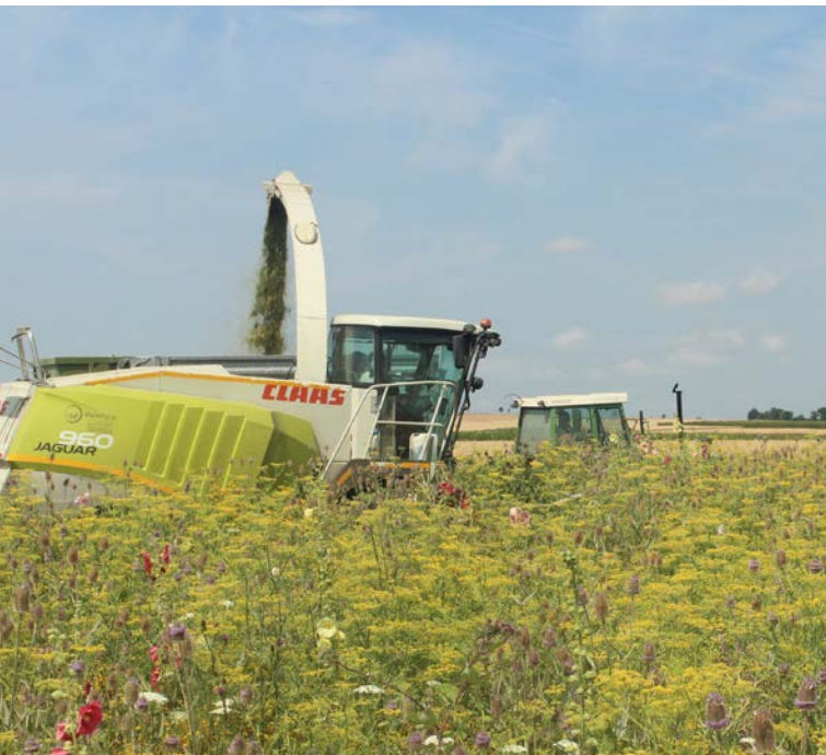
Ernte des Hanfmix im Juli