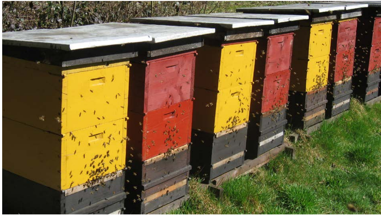
Je nach Standort kann der Eintrag unerwünschter Stoffe in das Bienenvolk variieren.