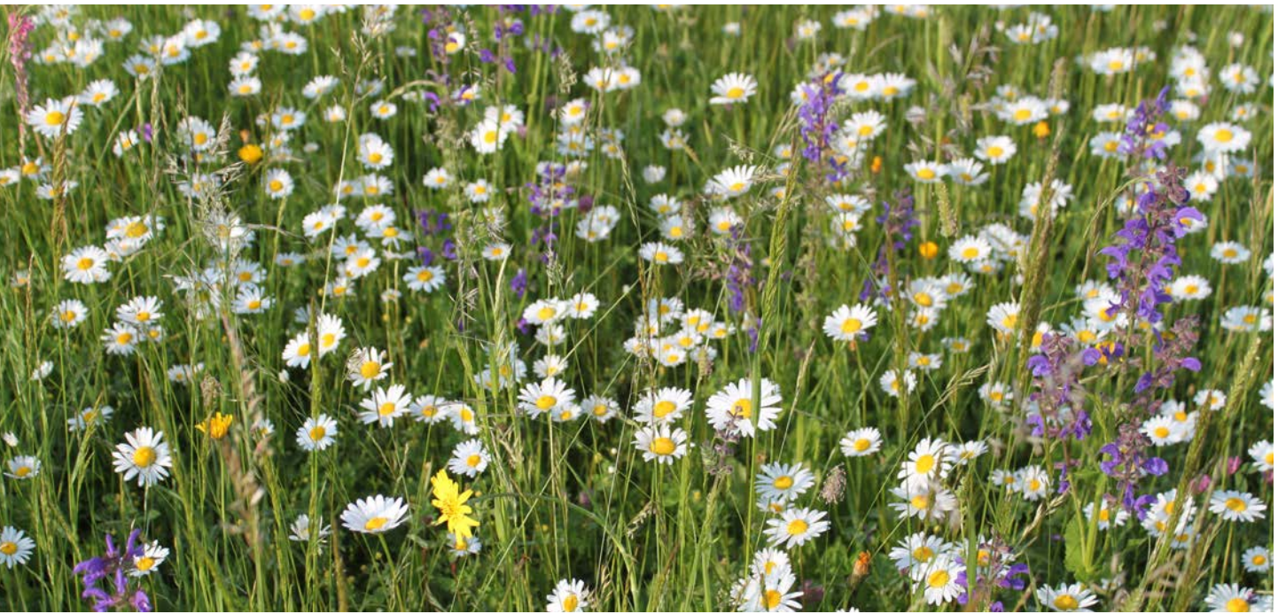
Bunte Wiesen erfreuen nicht nur Bienen.