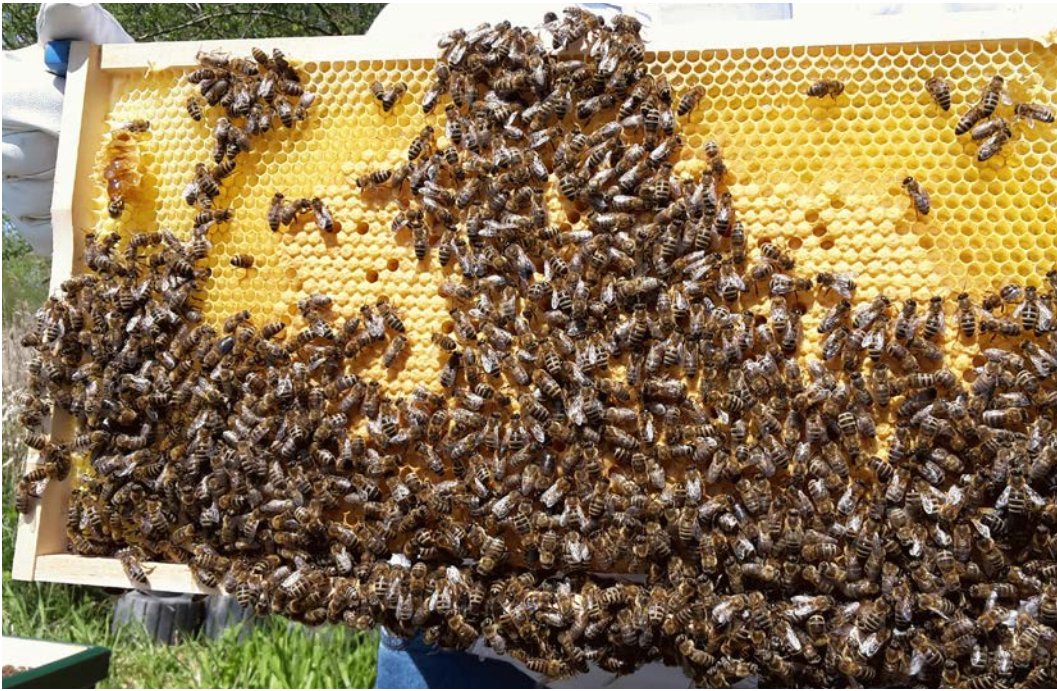
Ein kräftiges Bienenvolk ist die Freude eines jeden Imkers.