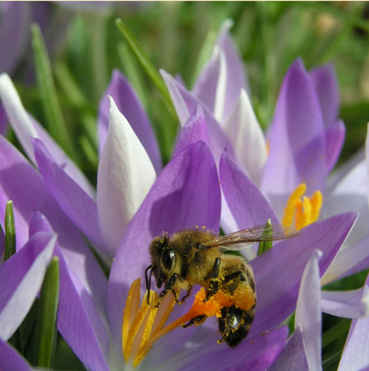
Die Imkerei ist die Poesie der Landwirtschaft.