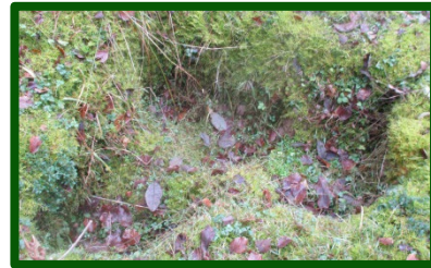
... und am Tag danach